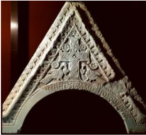
Slika 1: zabat iz Uzdojka kod Knina