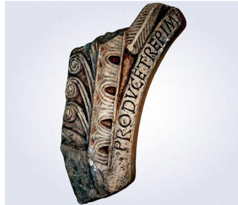
Slika 2: ulomak iz Rižinica